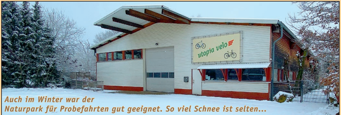
Auch im Winter war der Naturpark für Probefahrten gut geeignet. So viel Schnee ist selten...